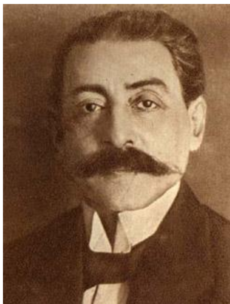
Рис. 1. Иосиф Маркович Гольдштейн (1868–1939 гг.)

И.М. Гольдштейн родился в Германии в семье еврейских одесситов. Следуя наставлениям семьи, он поступил на инженерно-химический факультет Политехникума в г. Карлсруэ, однако уже в процессе учебы научные пристрастия Гольдштейна начинают склоняться в пользу экономики. Получив диплом инженера-химика, молодой студент еще в техникуме начинает заниматься проблемами финансов и экономической теорией. Однако, научная сфера интересов Гольдштейна снова меняется и он поступает на факультет государственоведения Мюнхенского университета (г. Мюнхен), защитив в 1895 году докторскую ученую степень по политэкономии. Подобный поиск собственного творческого пути дал ученому прекрасную эрудицию, весьма широкий научный кругозор и энциклопедические знания не только в экономической науке, но и в смежных отраслях знаний, в частности в политологии, социологии, географии и демографии, статистике.